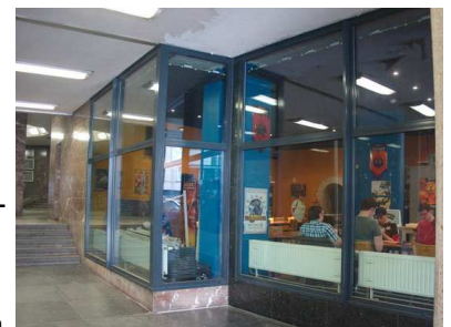
L'OUTPOST : notre enfer du jeu